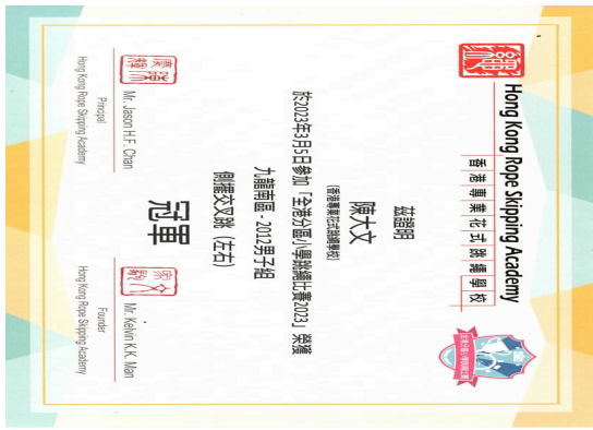
(得獎證書 - 示意圖)