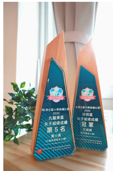
(專屬總成績獎座 - 示意圖)